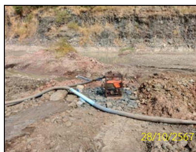
ภาพที่ 1-1 บริเวณหน้าเหมืองของโครงการ